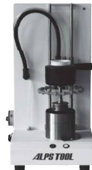
空冷キット T1-AJ Air Cooling Kit T1-AJ