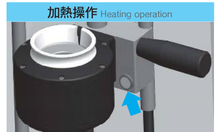
加熱操作 Heating operation コイル位置決め後にハンドル横のボタンを押すだけの簡単操作。ボタンを押している間のみ加熱。 Manual mode heating (keep heating during start button is pushed.)