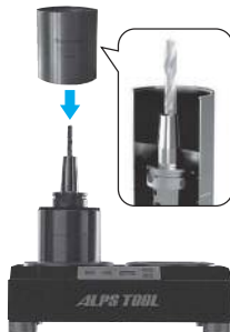
冷却ファン装置 ISGK2002 Cool Station ISGK2002