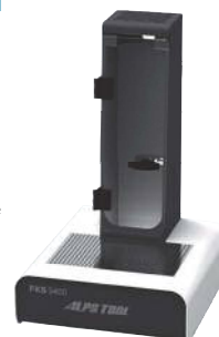
水冷装置 FKS3400MZ Water Chiller Unit FKS3400MZ